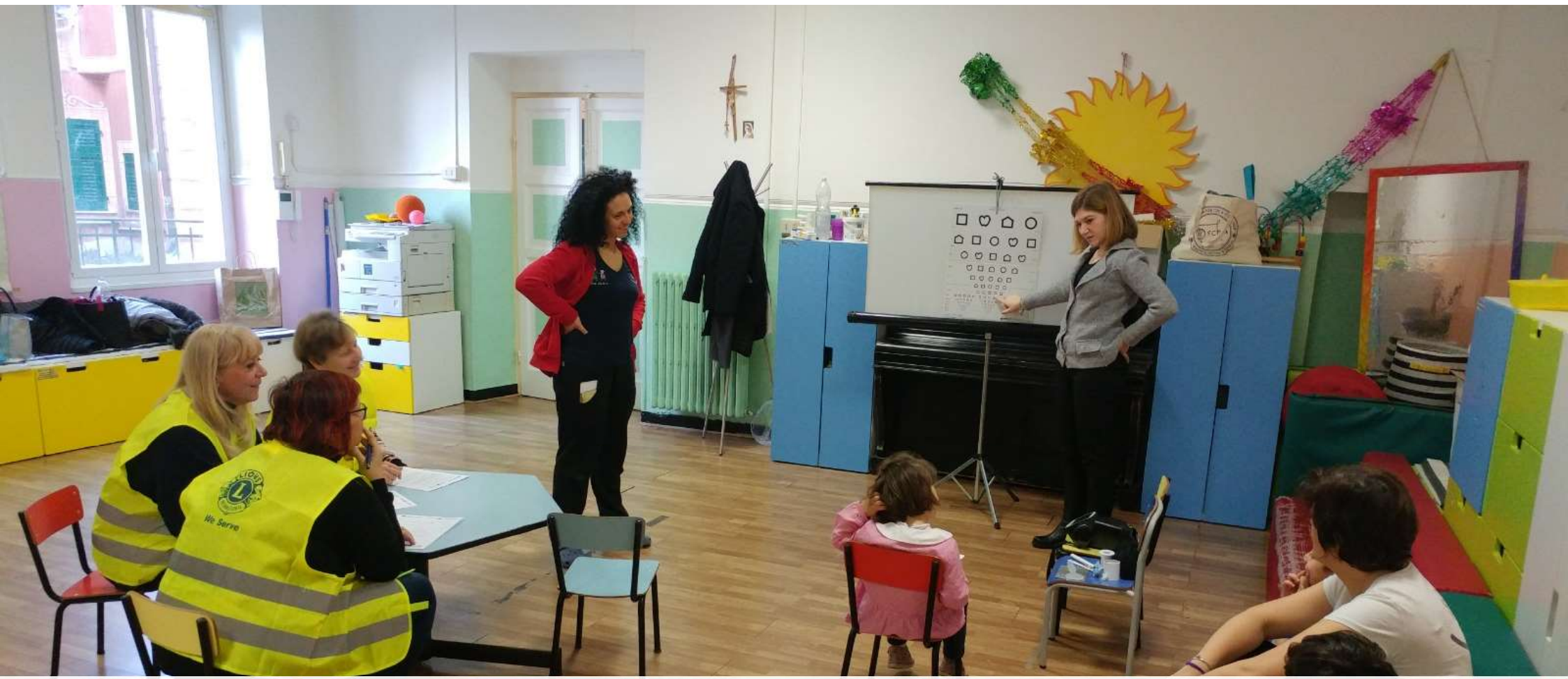
Sight for Kids Campagna di prevenzione dell'ambliopia