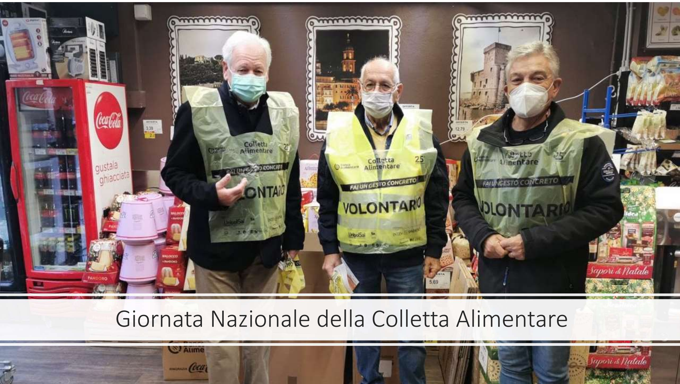
Giornata Nazionale della Colletta Alimentare